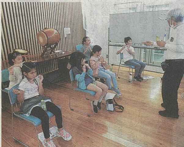
横笛の音を出す練習をする子どもたち

「子どもD.O.まんなかひろば」始まる 子どもたちが自分で決めたことをして過ごし、多くの友だちをつくる機会と居場所を提供する「子どもD.O.まんなかひろば」が11日、長浜市高田町のささなみタウンで始まった。毎月第2土曜に開かれる。