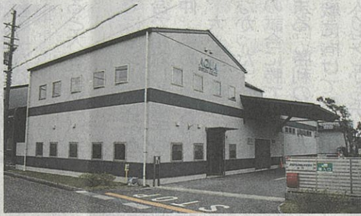
アクアシステム須越工場

アクアシステム 産業用ポンプメーカー。1947年に船舶などに使われるウイングポンプの製造で創業。現在はドラム缶に取り付けるエア式ポンプを主力商品として製造、販売している。彦根市に本社、工場があり、国内の従業員数は4月末時点で36人。中国やタイなどにも事業所を置く。2023年2月〜24年1月の売上高は約9億3千万円。22年には健康経営優良法人に認定されている。