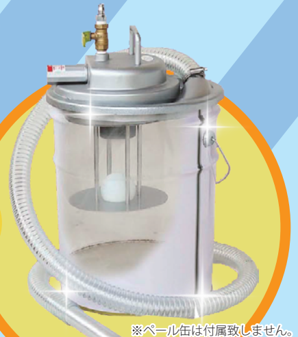
※ペール缶は付属致しません。