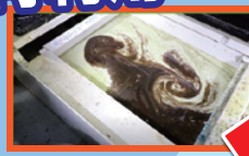
切粉・スラッジ・ヘドロ 混じりの切削液が