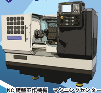
NC 旋盤工作機械 マシニングセンター