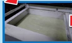
切粉やスラッジが、ろ過され クーラント液再利用！